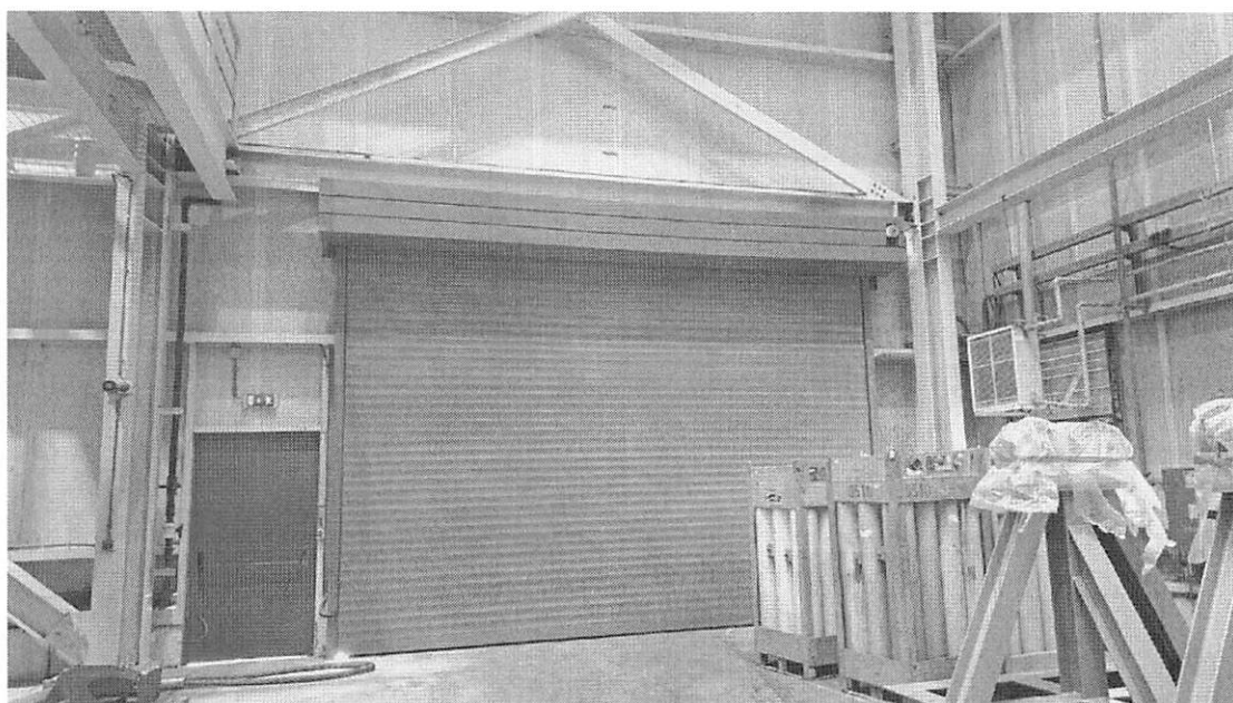
Εσωτερική πλευρά κτιρίου Μηχανοστασίου