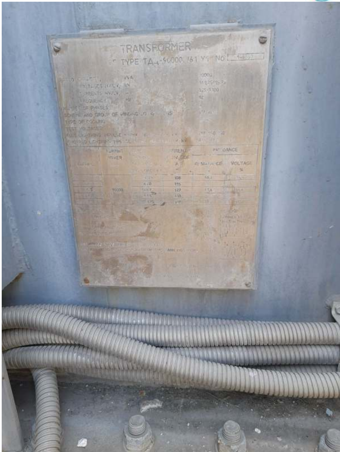
Εικόνα 3 Πανακίδα - Μ-Σ ΑΗΣ Πτολεμαΐδας 3