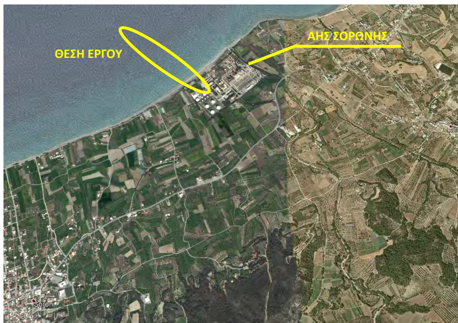
Εικόνα 2β: Δορυφορική φωτογραφία των Εγκαταστάσεων του ΑΗΣ Σορωνής Ρόδου και της θέσης του έργου