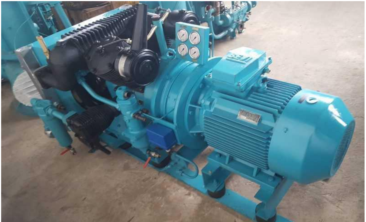
Εικόνα του τύπου αεροσυμπιεστή που βρίσκεται εγκατεστημένος στη μονάδα παραγωγής του ΑΗΣ Ρόδου από το 1998.