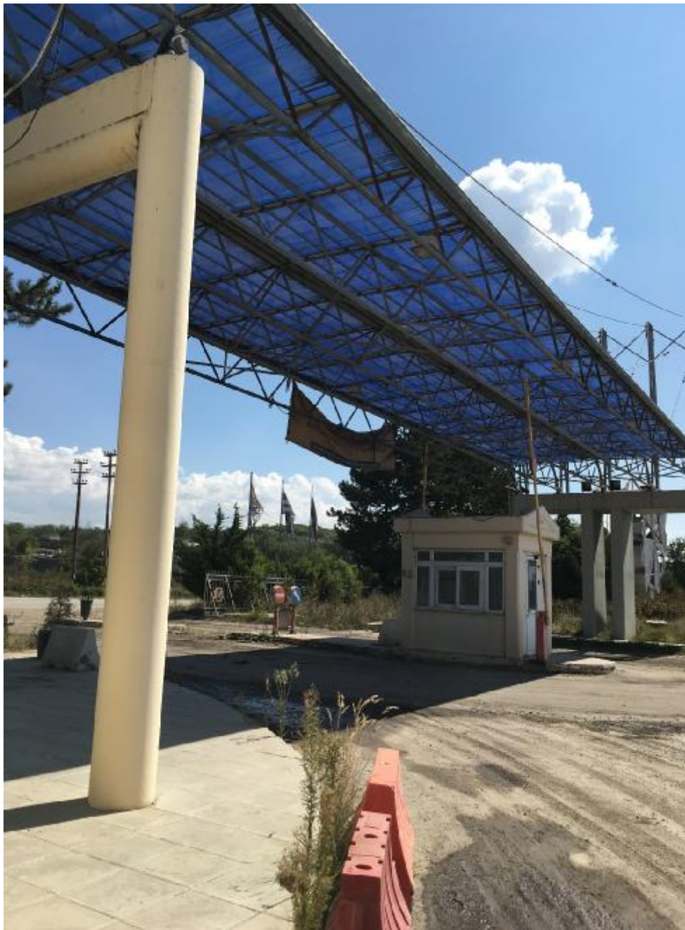
Το φυλάκιο και το χαρακτηριστικό στέγαστρο της εισόδου