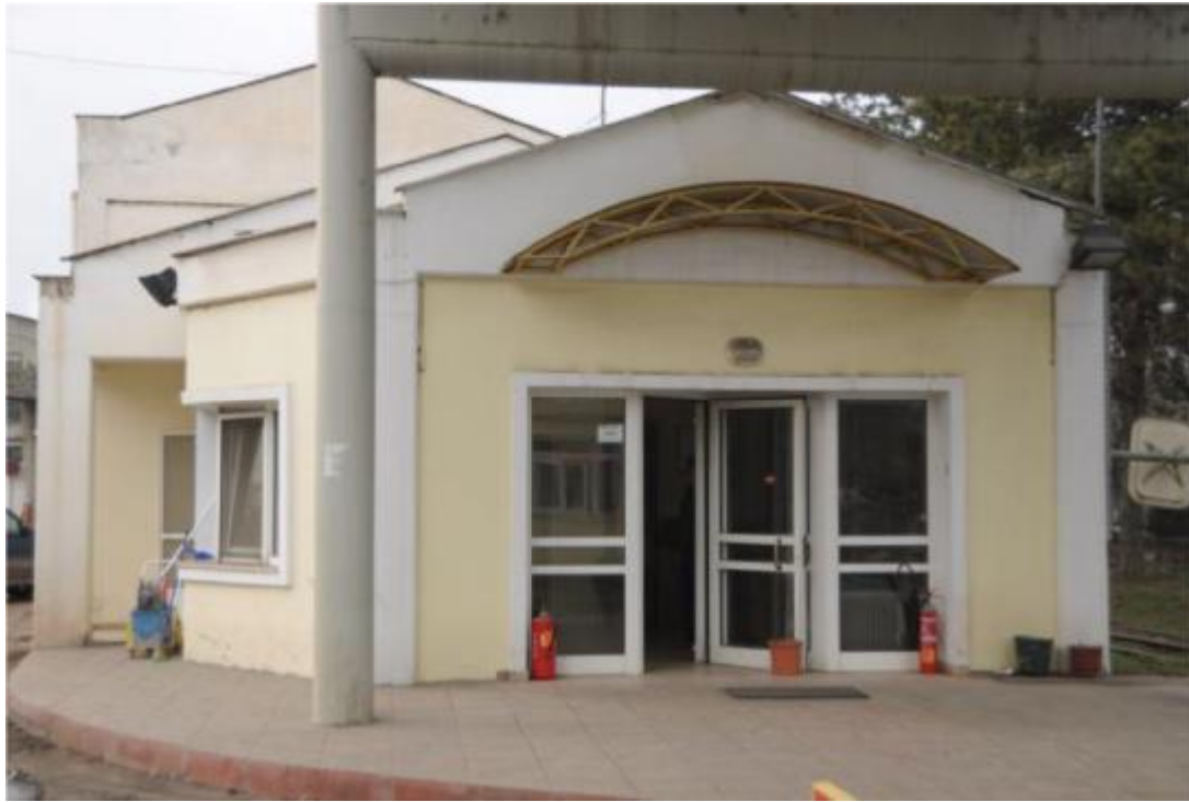
Κτίριο υποδοχής παλιού Διοικητηρίου

Στην είσοδο του παλιού Διοικητηρίου βρίσκονται ακόμα το φυλάκιο , το χαρακτηριστικό στέγαστρο της ΔΕΗ με τον καδοτροχό και ο χώρος υποδοχής και πληροφόρησης. Τα κτίρια αυτά , χτισμένα από οπλισμένο σκυρόδεμα, οπτοπλινθοδομές και στέγη με κεραμίδια, θα κατεδαφιστούν, ενώ το στέγαστρο θα αποξηλωθεί , θα μεταφερθεί στην νέα είσοδο των Ορυχείων και θα επανατοποθετηθεί.