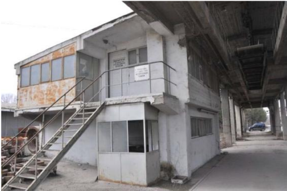
Υποστηρικτικό κτίριο δίπλα στο κτίριο φόρτωσης