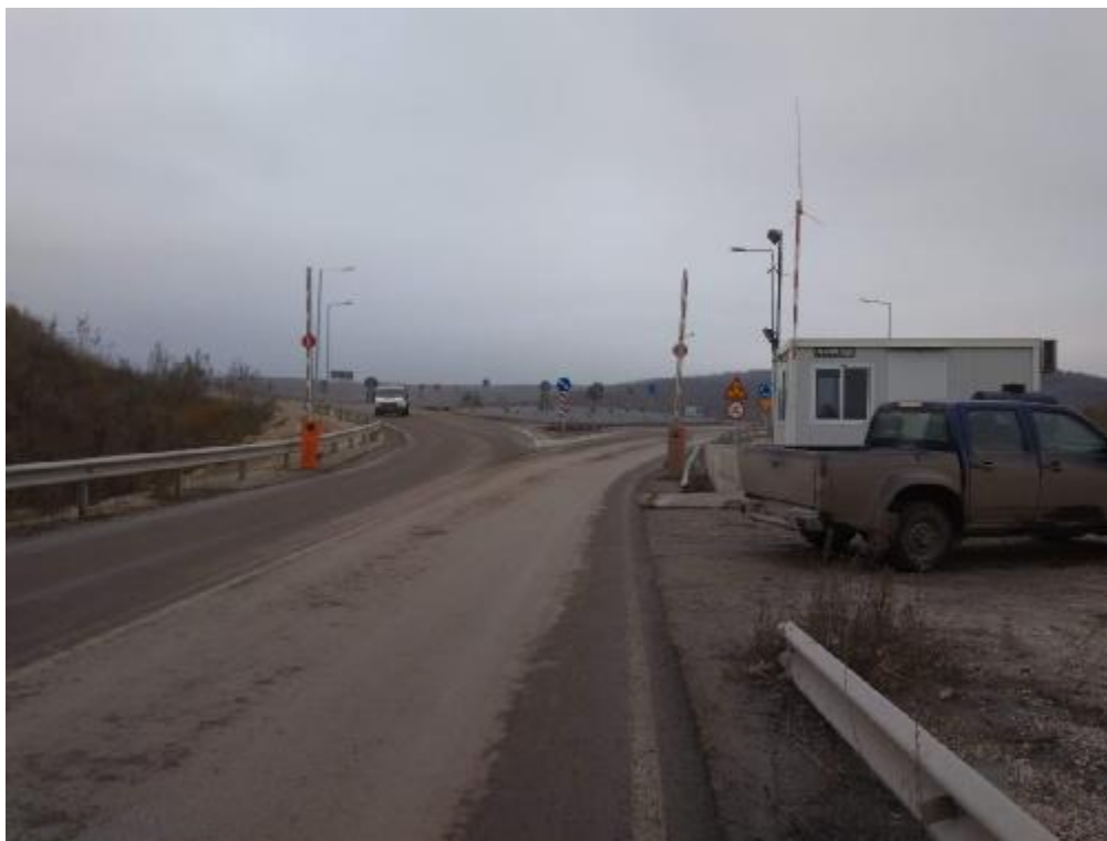
Ένα από τα πιθανά σημεία επανατοποθέτησης του στεγάστρου