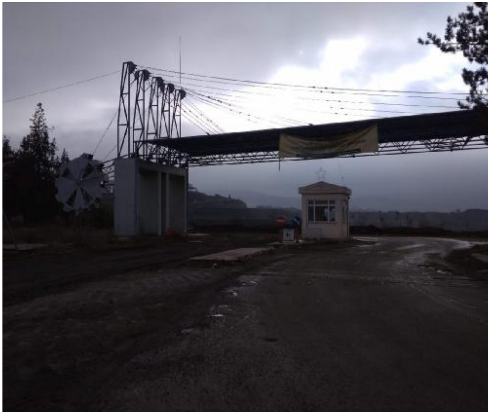
Το χαρακτηριστικό στέγαστρο της εισόδου